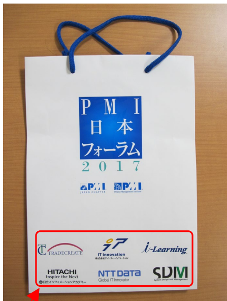
【イベントバッグの外装部】