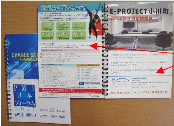
【プログラム冊子への企業広告】