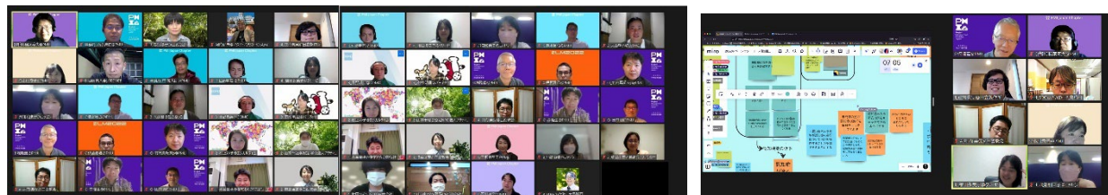
図3 ワークショップの様子

後半のワークショップではPMI日本支部がロールプレイ用に用意した、マルチステークホルダー型の仮想SDGs事業シナリオを基に、2030年のPEST分析や共感マップ分析を基に実際にデザイン思考からアイデアを創発しリーンキャンバスの作成を体験していただきました。